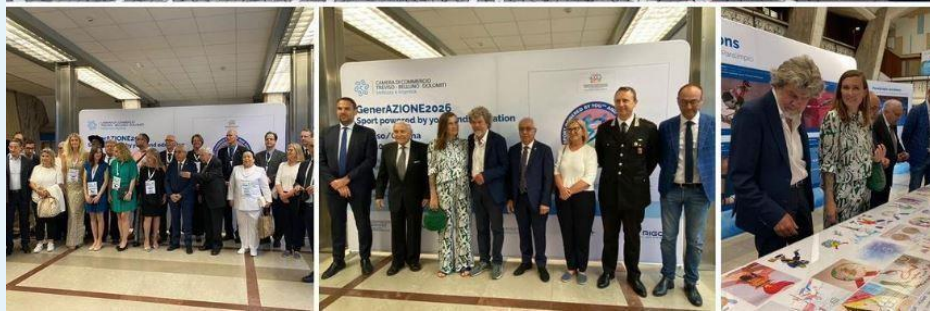
Cerimonia di inaugurazione delle mostre GenerAZIONE2026 presso la Camera di Commercio di Treviso – Belluno/Dolomiti